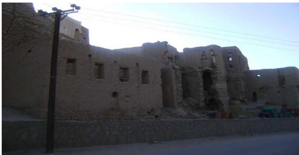
ملحق رقم (2) صورة موقع مدرسة جمعية الأخوة والمعونة للبنات بتريم السحيل