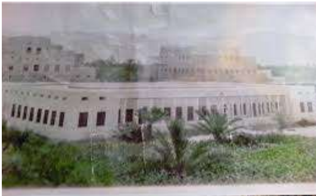
ملحق رقم (1) صورة لمبنى مدرسة جمعية الأخوة والمعونة -بنين بمنطقة النويدرة بتريم الذي تم